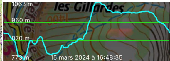
Sens des aiguilles