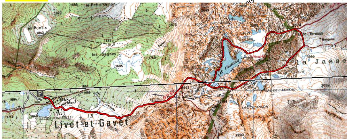
21 Mar - 22.08.19 Lac Fourchu, Pas de l'Envios, Lac de l'Agneau Elevation